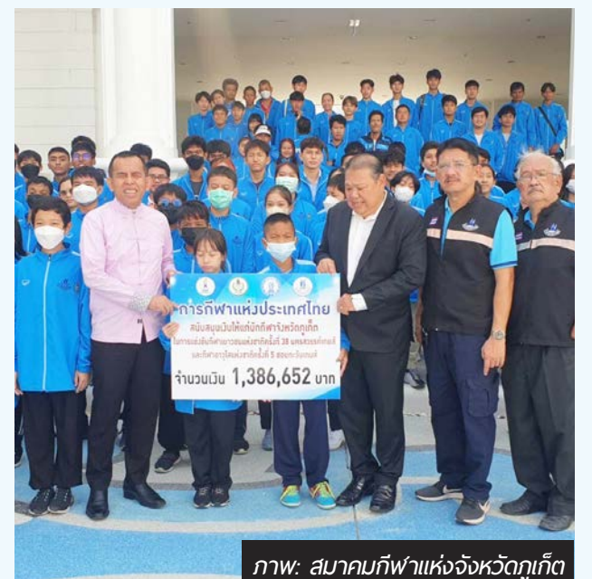
ภาพ: สมาคมกีฬาแห่งจังหวัดภูเก็ต