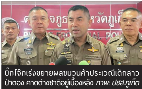
บิกโจกร่งขยายผลขบวนค้าประเวณีเด็กสาวป่าตอง คาดต่างชาติดู้อยู่เบื้องหลัง ภาพ: Uba.ภูเก็ต

“ในส่วนการเสียภาษี นอมินี ผบ.ตร.ภ.8 จะตั้งชุดทำงานร่วมกับ ตม.ขยายผลทั้งหมด แม้นายรอนนี่จะหลบหนีออกนอกประเทศซึ่งทราบว่าย้ายไปลาว แต่ไม่เป็นไรทางเรามีความสัมพันธ์ที่ดีกับทางประเทศลาวอยู่แล้ว ขอให้ออกหมายจับก็จะประสานกันใน