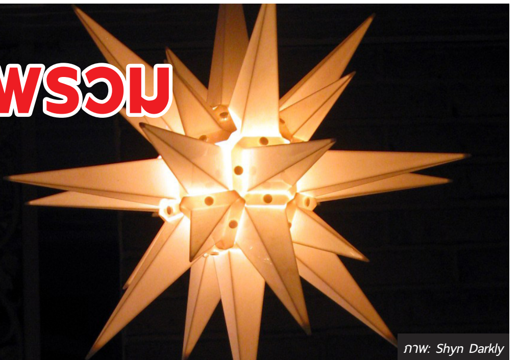
ภาพ: Shyn Darkly