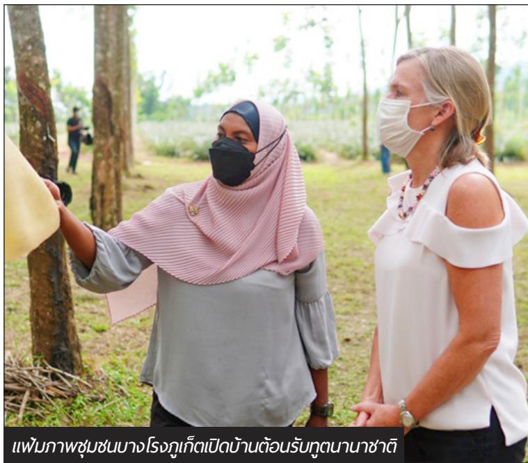
พบภาพชุมชนบางโรงภูเก็ตเปิดบ้านต้อนรับทูตนานาชาติ

ประเทศไทยได้รับการยอมรับจากนักท่องเที่ยวทั่วโลกในการเป็นจุดหมายปลายทางด้านการมาท่องเที่ยว เนื่องจากมีความพร้อมในด้านทรัพยากรทางการท่องเที่ยว ตลอดจนความพร้อมในด้านการเข้าถึงแหล่งท่องเที่ยว และการให้บริการที่ดีแก่นักท่องเที่ยวซึ่งแสดงถึงเอกลักษณ์ความเป็นไทยในการพัฒนาแหล่งท่องเที่ยว สถานที่ท่องเที่ยว บริการด้านการท่องเที่ยว และผลิตภัณฑ์ต่าง ๆ ให้สอดคล้องกับพฤติกรรมนัก