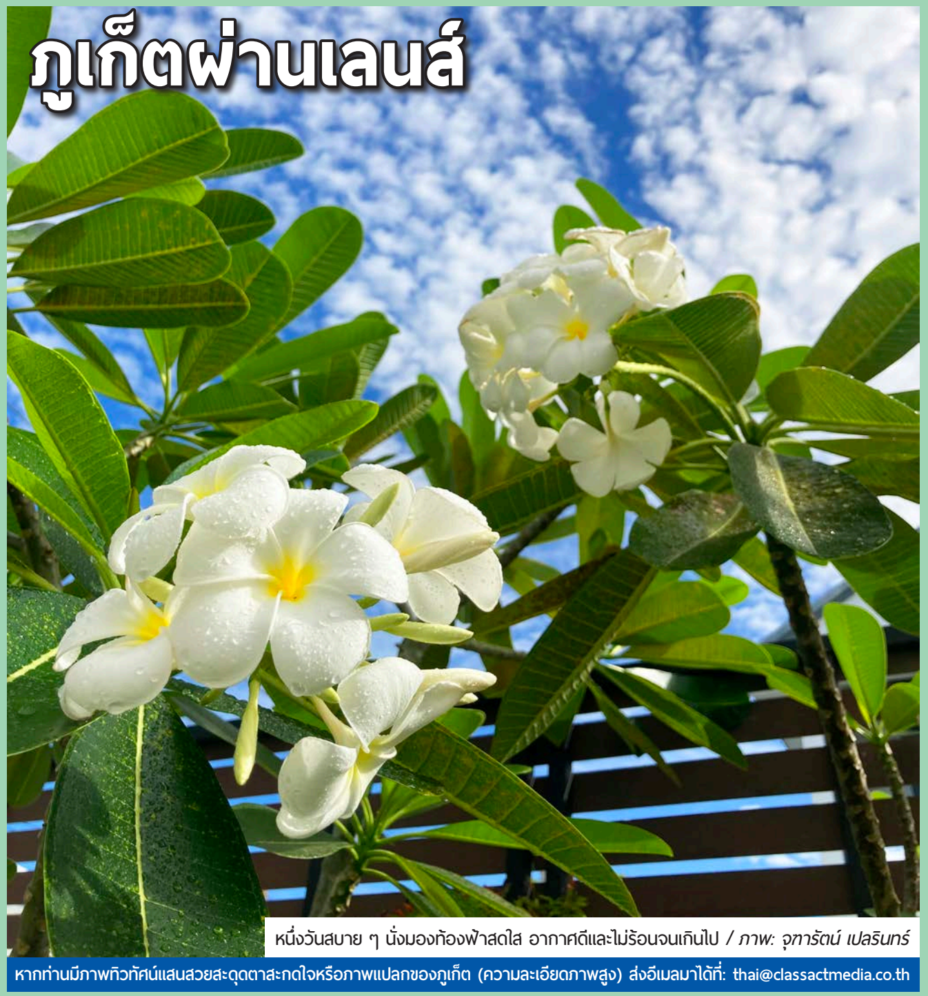
หนึ่งวันสบาย ๆ นั่งมองท้องฟ้าสดใส อากาศดีและไม่ร้อนจนเกินไป

หากท่านมีภาพทิวทัศน์แสนสวยสะดุดตาสะกดใจหรือภาพแปลกของภูเก็ต (ความละเอียดภาพสูง) ส่งอีเมลมาได้ที่: thai@classactmedia.co.th